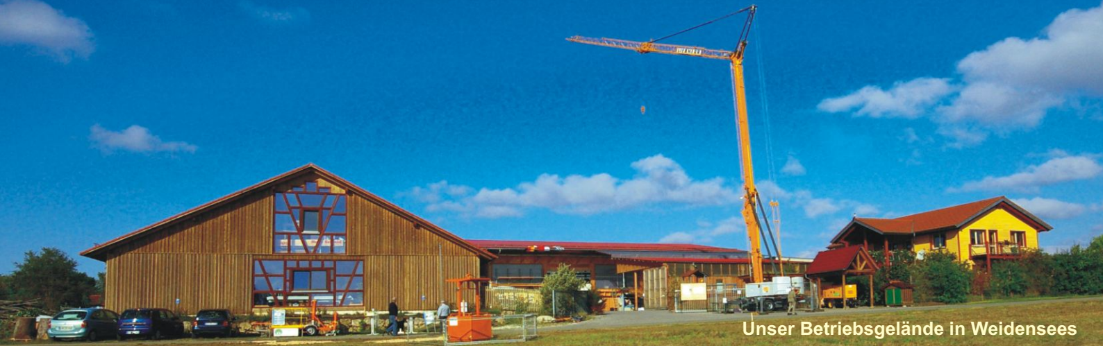
Unser Betriebsgelände in Weidensees